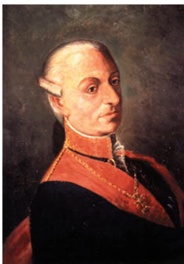
Fig. 1. Ritratto del Principe di Caramanico, Viceré di Sicilia (Museo della Specola, INAF-Osservatorio Astronomico di Palermo)

Nell'attuare il suo programma di riforma, la Deputazione fu fortemente sostenuta da due personalità dall'impronta fortemente riformista, quali il marchese Domenico Caracciolo (1715-1789), proveniente dai circoli illuministici parigini, che fu Viceré di Sicilia dal 1781 al 1786, e il suo successore Francesco D'Aquino, Principe di Caramanico (1738-1795) (Fig.1), esponente di spicco della massoneria, al quale si deve la spinta decisiva per la creazione dell'Osservatorio di Palermo.