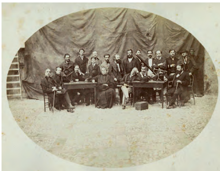
Fig. 7. Foto del personale della stazione astronomica allestita ad Augusta per l'eclisse del 1870

L'evento ebbe inoltre un modesto ma significativo impatto nell'opinione pubblica e vide la mobilitazione di un certo numero di volontari astrofili (rimane traccia di poco più di una quarantina di loro) che, debitamente istruiti, collaborarono a osservare il fenomeno in diverse stazioni siciliane, descrivendo e disegnando i risultati delle loro osservazioni. Si assistette pertanto, in questa circostanza, a un tentativo – inedito per la Sicilia – di portare l'astronomia fuori dai propri luoghi istituzionali, di cooptare i cittadini più colti nell'attività di ricerca, invitandoli e stimolandoli alla collaborazione, coinvolgendo il territorio e le istituzioni locali – in definitiva, di rendere accessibile l'astronomia anche ai non specialisti.