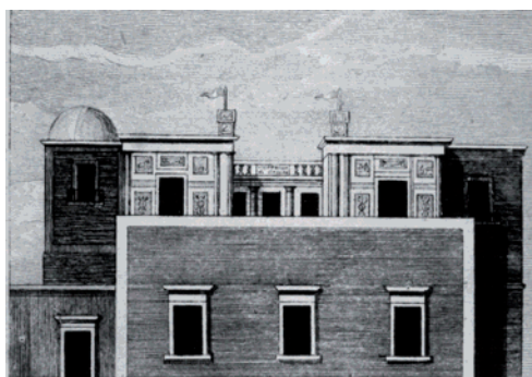
Fig. 3. L'Osservatorio di Palermo nel 1801