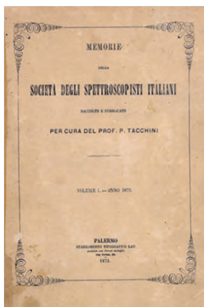
Fig. 6. Frontespizio del primo numero delle Memorie della Società degli Spettroscopisti Italiani (Biblioteca INAF-Osservatorio Astronomico di Palermo)

immediato successo soprattutto all'estero, malgrado il limite dell'uso prevalente della lingua italiana. Il periodo che va dal 1865 al 1880 è dunque certamente un periodo luminoso per l'astronomia siciliana, anche per un'altri motivi di cui si dirà più sotto. Tale periodo si inquadra in una fase di rilancio della scienza siciliana in generale: a Palermo, infatti, si terrà nel 1875 il Congresso degli Scienziati Italiani, a conferma del ruolo di polo culturale e scientifico, svolto dal capoluogo siciliano in quegli anni.