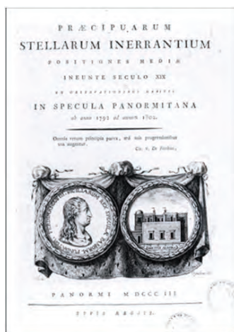
Fig. 4. Frontespizio del catalogo stellare di Piazzi del 1803 (Biblioteca INAF-Osservatorio Astronomico di Palermo)

Il programma scientifico di Piazzi era molto chiaro e definito: egli si pose subito in linea con il principale filone di ricerca della sua epoca, ovvero l'astrometria. Tutto il Settecento aveva visto un'importante produzione di cataloghi stellari che avevano indirettamente portato alla scoperta di fenomeni quali l'aberrazione della luce e la nutazione dell'asse terrestre. L'Osservatorio di Palermo, il più a sud in Europa, si trovava in una posizione favorevole per osservare una fascia di cielo meno esplorata: l'obiettivo di Piazzi era pertanto quello di realizzare un catalogo stellare, di cui pubblicherà una prima edizione nel 1803 (contenente più di 6000 stelle) (Fig. 4) e una seconda edizione, ampliata e riveduta (contenente oltre 7000 stelle), nel 1814.