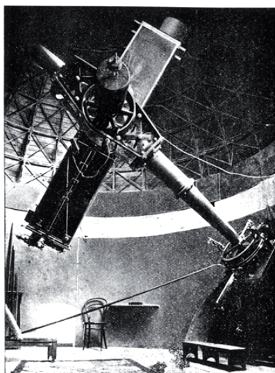
Fig. 8. L'equatoriale fotografico della Carte du Ciel dell'Osservatorio Astrofisico di Catania

Il XX secolo si aprì carico di potenzialità: cominciava ad estendersi sul territorio siciliano l'attività di ricerca, affiancata a quella didattica, raramente a quella divulgativa. Tacchini era ormai a Roma, dove dirigeva l'Ufficio Centrale di Meteorologia e l'Osservatorio del Collegio Romano, già diretto da Secchi. Era riuscito a inserire l'Osservatorio di Catania nel circuito internazionale del progetto Carte du Ciel (Fig. 8), per la realizzazione della prima mappa fotografica dell'intero cielo, cui partecipavano 18 Osservatori di tutto il mondo – e Catania rappresentava l'Italia, in questo consesso (Chinnici 1999, pp. 452-460).